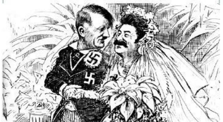
Berryman, C. (1939). ¿Cuánto durará la luna de miel? (Probablemente publicada en el Washington Star). (S. i.).

La siguiente caricatura muestra lo que se preguntaba un diario norteamericano tras la firma del pacto de no agresión entre Alemania y la Unión Soviética.