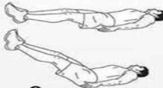
8. ABDOMINALES INVERTIDOS