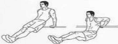
4. SENTADILLAS DE TRICEPS