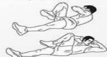
9. ABDOMINALES DE BICICLETA