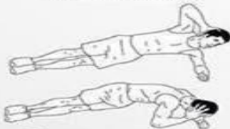
7. ABDOMINALES LATERALES