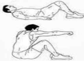
5. ABDOMINALES CRUZADOS